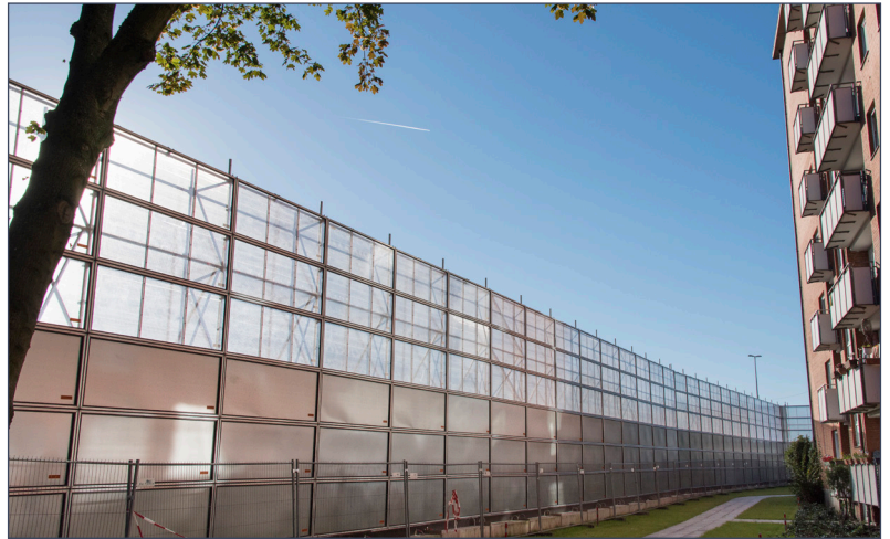
Muro de protección contra el ruido.