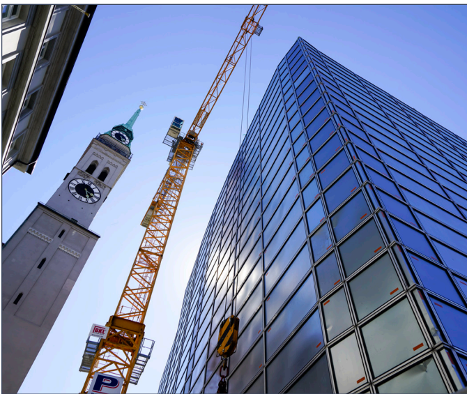
Construcción de edificio en centro urbano.