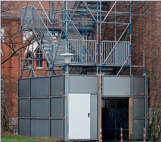
Sistema Protect en escalera de emergencia.