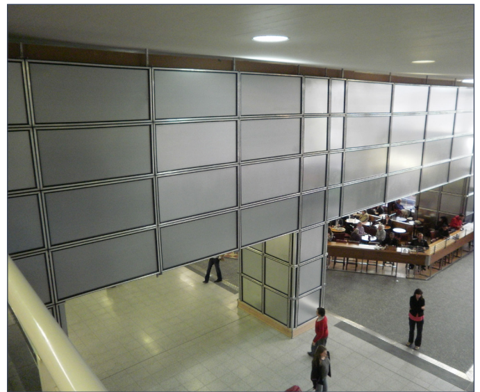
Protección peatonal en obra de rehabilitación.