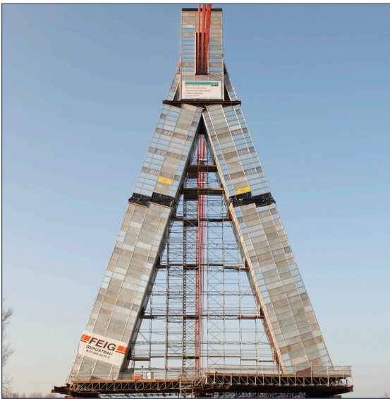
Trabajos con chorro de arena.